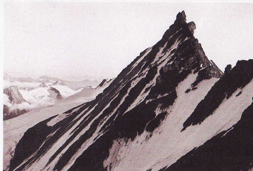
Dr. Karl Kaser | „Großglockner“ (Gosau) im 1900

Die Ausstellungen der Fotogalerie Gmünd stehen auch im Jahr 2011 ganz im Zeichen der künstlerischen Gattung „Dokumentarfotografie“ und dies auf höchstem Niveau. Auch die Fotogalerie zeigt Arbeiten mit dem Bezug „Berge“. Zum einen ist es gelungen, auf ein bisher verborgenes Archiv des Wiener Landschaftsfotografen Dr. Karl Kaser zurückzugreifen, der von 1898 bis 1939 in Österreich mit seiner Großbildkamera auf Motivsuche gegangen ist und zahlreiche Berge bestiegen hat,